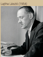
Lajtha László (1954)