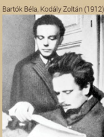
Bartók Béla, Kodály Zoltán (1912)