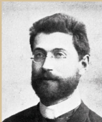
Vikár Béla (1910)