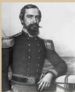
Xántus János (1861)

Adatbázisaink is itt érhetők el: www.neprajz.hu