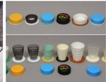
Mobilitás és összecsukhatóság // A Néprajzi Múzeum Napja