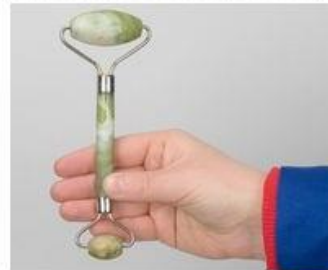
Egy jade arcroll