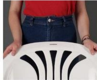
Egy fehér műanyag kerti szék