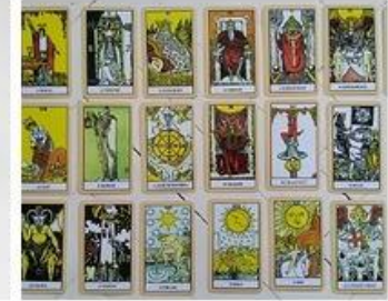
Kártyalapok, műtárgyak és muzeológusok asztaltársasága