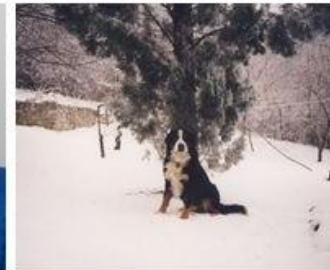
Ami látszik, és ami nem: Ludo