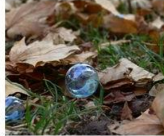
Ami látszik és ami nem: Tanulás

NYITÓOLDAL > MADOK-PROGRAM > KUTATÁSOK, SZOROZATOK > KORTÁRS MŰTÁRGYAK